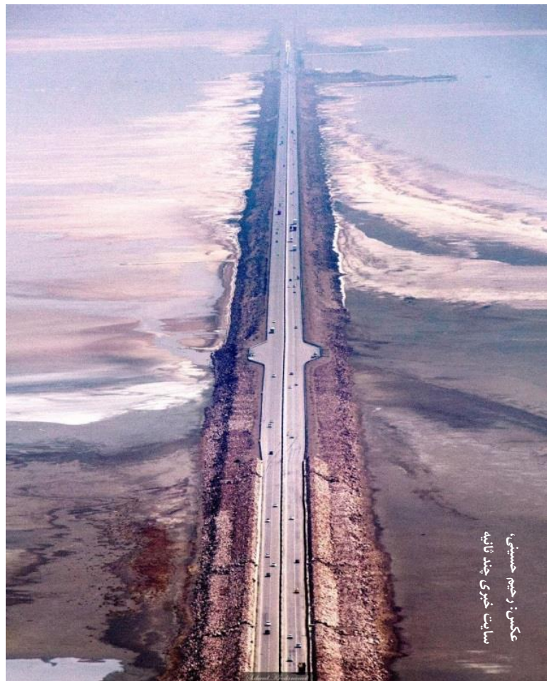
پل روی دریاچه ارومیه

احداث پل روی دریاچه ارومیه با ایجاد مانع فیزیکی، ارتباطات و پراکندگی گونه‌های جانوری و گیاهی را مختل کرده و بر اکوسیستم آبی این دریاچه تأثیر منفی گذاشته است. این تغییرات، تاب‌آوری فضایی منطقه را کاهش داده و چالشی برای تعادل زیستی دریاچه ایجاد کرده است.