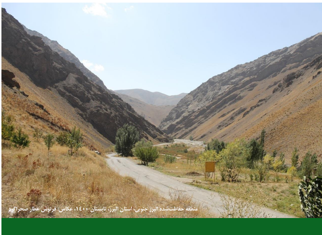
منطقه حفاظت‌شده البرز جنوبی، استان البرز، تابستان ۱۴۰۰