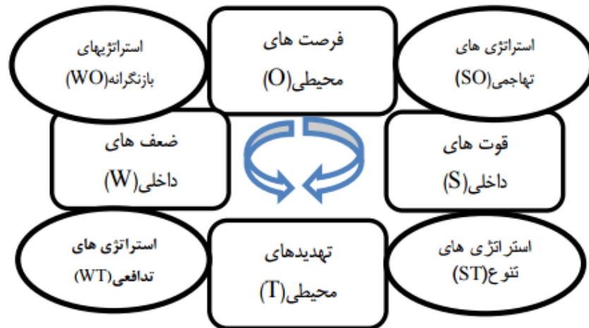
شکل ۲ مدل مفهومی شناخت شرایط راهبردی (SWOT)

به طور کلی تکنیک SWOT ابزاری برای تحلیل وضعیت و تدوین راهبرد است و این امور از طریق ۱-بازشناسی و